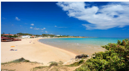
La spiaggia di Punta Braccetto

bronzo appoggiata sul muro; sta al visitatore decodificarla. Lo studio, a pochi passi dalla tenuta, sembra quello di un saldatore: ferro, legno, attrezzi e due grandi ritratti: "Michelangelo e Constantin Brâncuși. I miei miti".